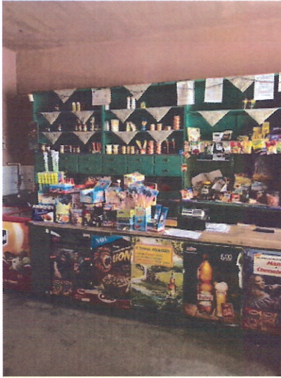
Im altertümlichen Dorfladen von Kisbacon ist die Auswahl nicht groß, aber alles Notwendige vorhanden.