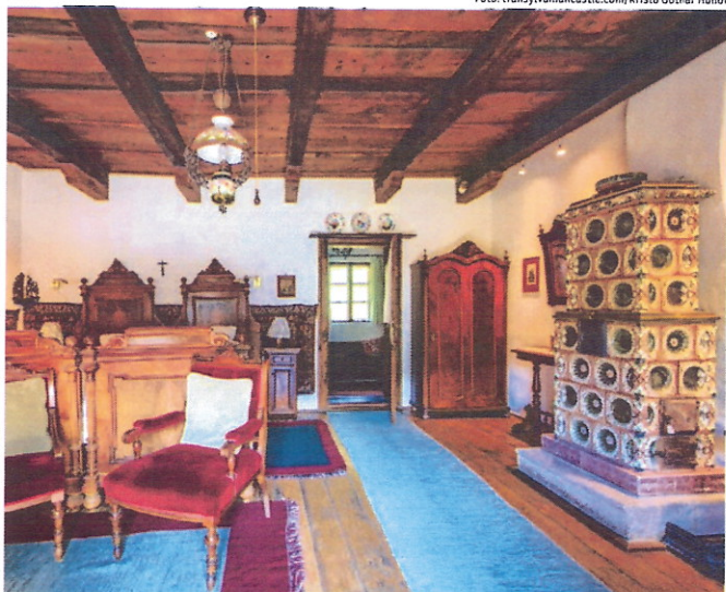
Königliches Refugium: das Gästehaus von Charles III. in Zalánpatak