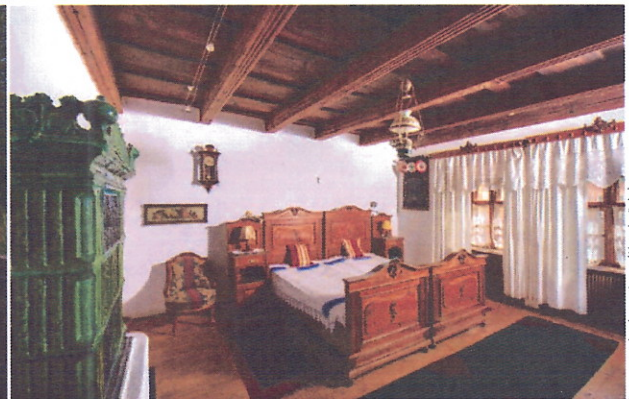
Das 1648 erbaute Jagdschloss der Kalnokys war dem Verfall preisgegeben, heute erstrahlt es renoviert und bereit für Gäste (li.). Das gräfliche Schlafgemach (re.)